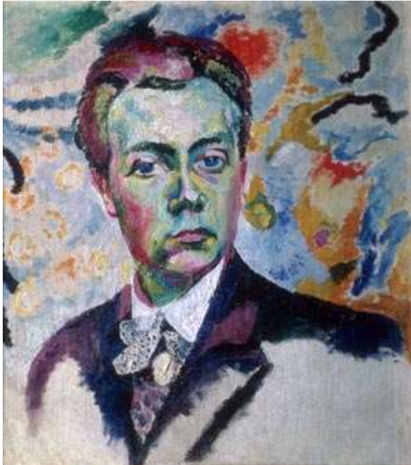
Selbstporträt 1905/06 Öl auf Leinwand Musée National d'Art Moderne, Paris

Der Künstler Robert Delaunay lebte von 1895 bis 1941 in Frankreich.