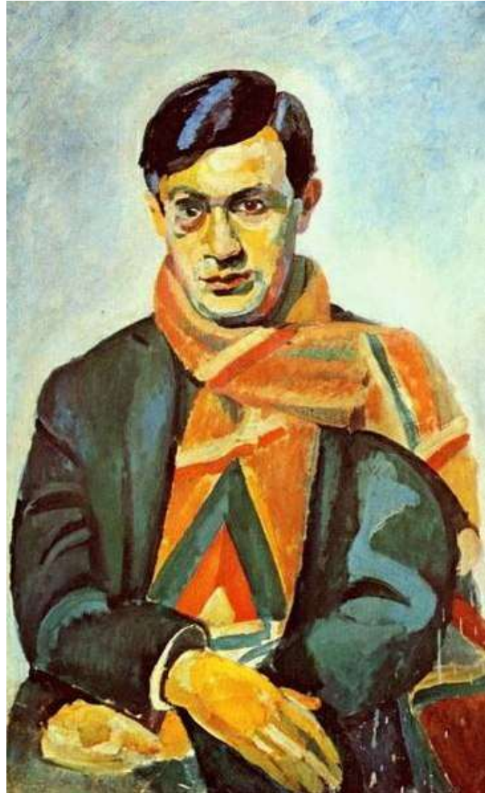
Porträt des Tristan Tzara 1923 Öl auf Leinwand Musée National d'Art Moderne, Paris

Aufgabenstellung umseitig! Wählen Sie eines der beiden Porträts aus!